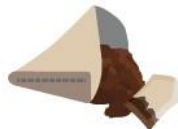
Marc de café, filtres, sachets de thé